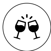
Ort des öffentlichen Lebens

Das baukulturelle Erbe und insbesondere die Ortskerne prägen die Gemeinden im Weinland sowie das Erscheinungsbild der gesamten Region in hohem Masse. Sie leisten einen wesentlichen Beitrag an die Lebendigkeit und Attraktivität der Gemeinden und sind ideale Orte, um deren einzigartigen Charakter sichtbar und erlebbar zu machen. Insbesondere übernehmen Zentren und Ortskerne eine Schlüsselrolle hinsichtlich: