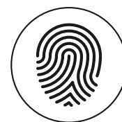
Identitäts- und Imageträger

Welcher Handlungsbedarf besteht bzw. welche Aufgaben obliegen den Gemeinden in Bezug auf die Zentrums- und Ortskernentwicklung?